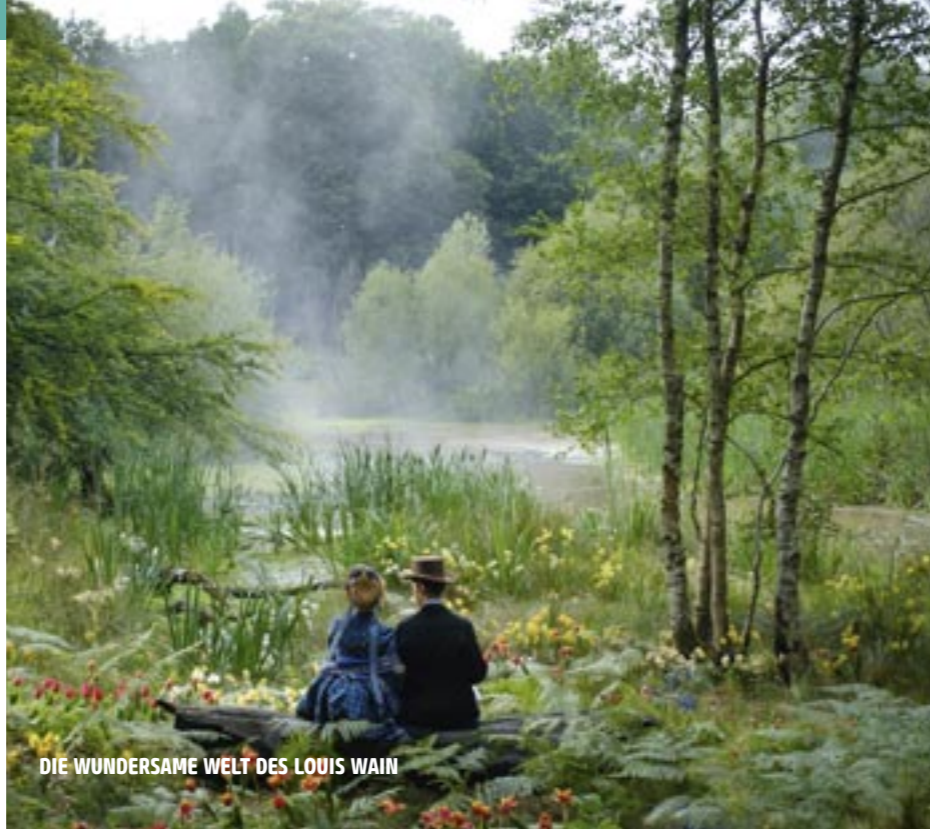
DIE WUNDERSAME WELT DES LOUIS WAIN

Eine Ode an die Schönheit dieser Welt und eine Mahnung, sie auch zu bewahren. Der preisgekrönte Wildlife-Fotograf Vincent Munier begibt sich zusammen mit dem Abenteurer und Schriftsteller Sylvain Tesson ins Herz des tibetischen Hochlands, wo sie sich auf die Suche nach einem Schneeleoparden begeben. Die beiden Männer durchstreifen tagelang das Gebirge, um eines der scheuen, extrem von Aussterben bedrohten Tiere mit eigenen Augen zu erblicken. Es ist eine kontemplative Reise, die den Blick dafür schärft, die Natur um hers herum wahrzunehmen.