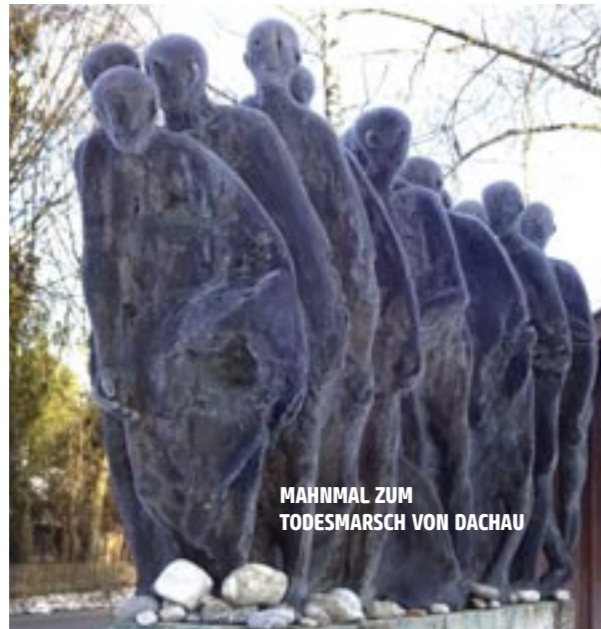
MAHNMAL ZUM TODESMARSCH VON DACHAU

Mit der Evakuierung des KZ Dachau begann das Finale der NS-Diktatur. Über 10 000 Häftlinge wurden auf einen letzten Marsch Richtung Alpen getrieben. Bewacht von Blut-hunden und SS-Einheiten begann ein Überlebenskampf. Wer erschöpft zusammenbrach, wurde an Ort und Stelle erschossen. Die Hauptrolle führte durch das Wümtal nach Starnberg, über Wolftratshausen nach Bad Tölz und Waakirchen, wo amerikanische Einheiten den Elendzug befreiten. Einstige Häftlinge kommen zu Wort und Zeitzeugen beschreiben, wie die Bevölkerung auf diesen „Geisterzug“ ausgemergelter Gestalten reagierte. "Und plötzlich standen sie in unseren Dörfern und Städten. Die einen haben die Türen versperrt, andere sind vor Schreck erstarrt und wieder andere haben Brot geholt und sich der Elenden erbarmt."